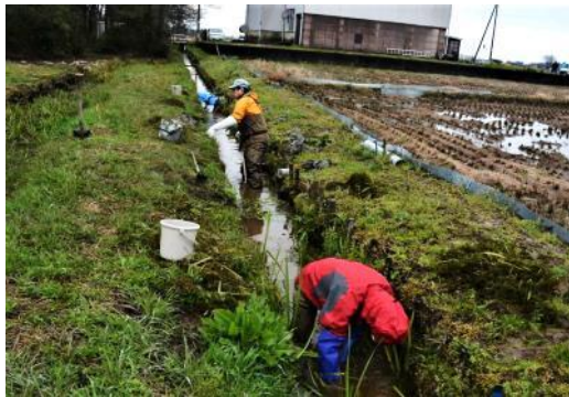
▲ トゲソの生息水路のドロ上げ