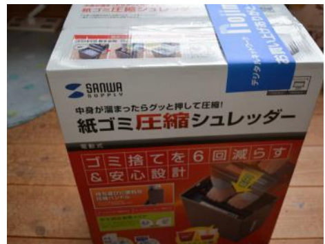
▲ イオンさんより支援の贈呈を頂く

当日、カードをいただき、さっそく、マウス、事務室スタンド、シュレッダーなどの事務用品と消耗品を買わせていただきました。毎年、ご支援ありがとうございます。