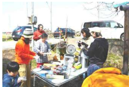
▲ 暖かな日差しの中、江ざらい作業 △みんなで一服。焼き芋とお茶会