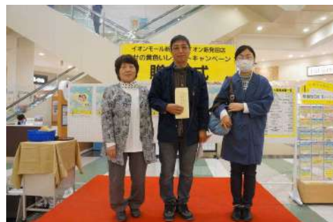
▲ 寄贈を受けた後の記念撮影

さっそく、プリンターのインクや野外用コンロなどの機材と事務用品を買わせていただきました。今後の活動に使用させていただきます。ありがとうございました。