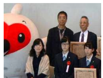
11月県環境特別賞受賞