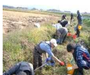
10月トゲソ生息調査