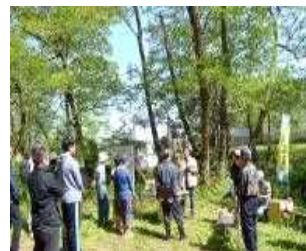
4月トゲソの観察会