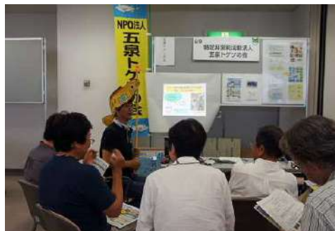
▲ プレゼンテーションとトゲソの会のブースを訪れてくれた皆さん。30人ほどが訪問。