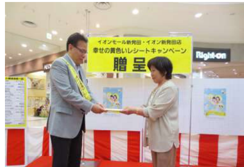
▲ イオンカードの寄贈を受ける

さっそく、パソコン用機器としてハードディスクなどの事務用品を買わせていただきました。今後の活動に使用させていただきます。ありがとうございました。