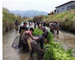
4月トゲソの観察会