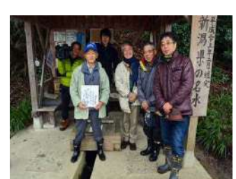
1月きらっと新潟取材