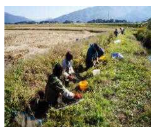
10月トゲソ生息調査